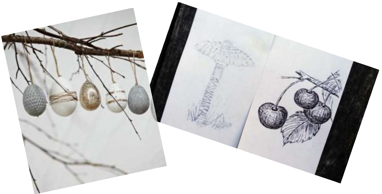
Tekening uit het Atelier